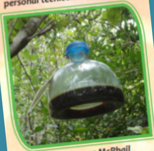
Fig. 5 Trampa McPhail