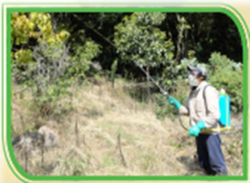
Fig. 11 Aplicación de cebo selectivo al follaje del árbol.

Tiene el objetivo de suprimir poblaciones de moscas de la fruta en estado adulto, mediante el uso de un cebo selectivo el cual se aplica por chisguetes dirigidos al follaje de los árboles de la parte media a la parte alta de la copa del árbol, el tamaño de gota deseado es de 3 a 6 mm. La ventaja del cebo es que únicamente es atractivo para las especies de moscas de la fruta.