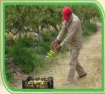
Fig. 9 Control mecánico en árboles frutales.