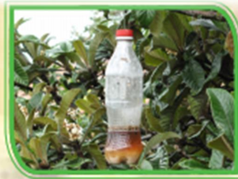
Fig. 12 Estación Cebo o trampa matadora.