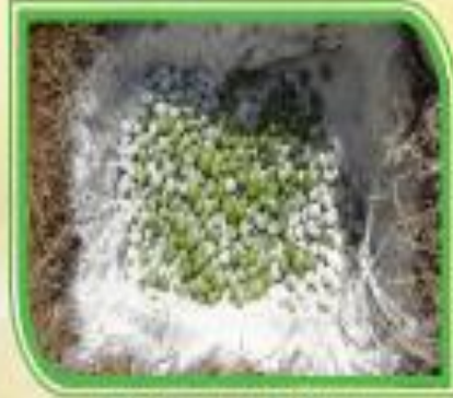
Fig. 10 Enterrar frutos dañados, en fosas con cal.