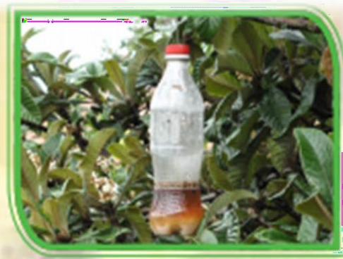
Fig. 12 Estacion Cebo o trampa matadora.