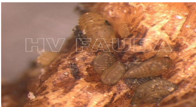
Ninfas de filoxera alimentándose de raíces de vid