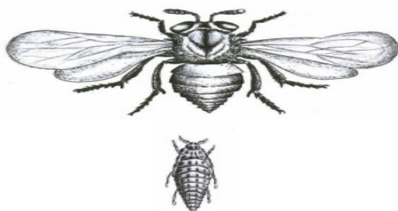
Macho y hembra de filoxera

Hojas amarillentas en la vid, que pueden indicar una deficiencia nutricional debido a la disminución de la absorción de nutrientes por las raíces que están siendo atacadas por la plaga. Los huevos y ninfas de la filoxera son pequeños y difíciles de detectar, pero pueden encontrarse en la superficie de las raíces o en el suelo cerca de la misma base de la vid.