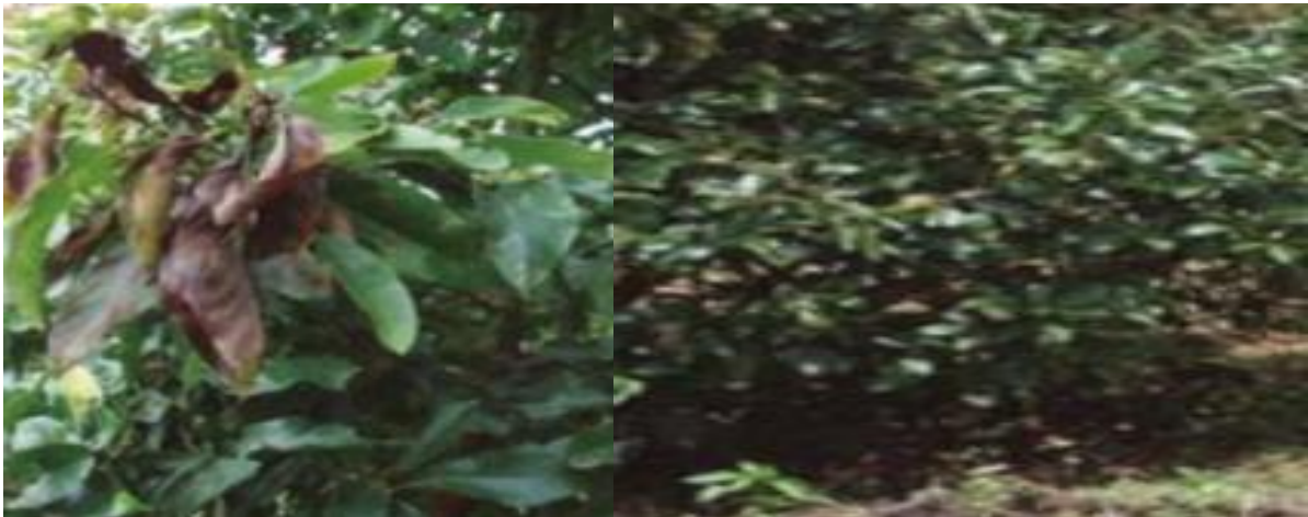
A. Árbol con determinados dañados.

Imagen 2: Localización chinche de en el follaje de aguacate.