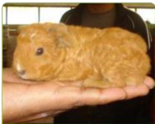
Cuy seleccionado para reproducción

Comienza con la identificación y evaluación de los cuyes padres, continúa con el nacimiento, destete y su desarrollo en la etapa recría. Se selecciona a los mejores animales como los futuros reproductores considerando las características productivas como: líneas y tipos de cuy, velocidad de crecimiento y otras características evaluadas en las mismas condiciones de manejo y sanidad.