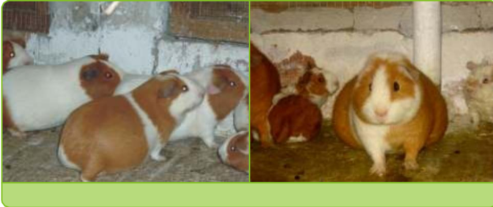
CUYES HEMBRAS EN PERIODO DE GESTACION

madre durante su vida reproductiva, luego la madre pasa a descarte para consumo o venta.