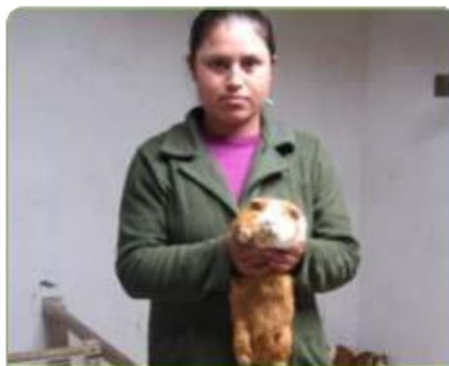
Productora seleccionando padrillo