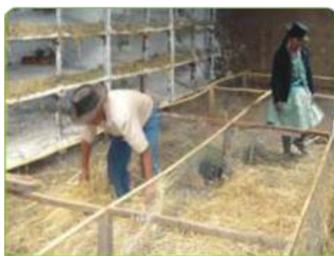
Antes de alimentar a los cuyes se debe garantizar la limpieza del galpón

Se recomienda una alimentación mixta (forraje más concentrado) en una proporción 80/20, debido a que los pastos son más baratos. Esto quiere decir que de 100 gramos de alimento, 80 gr. es forraje y 20 gr. es concentrado. (GUIA DE PRODUCCION DE CUYES-CARE PERU)