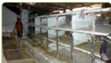
GRANJA DE MODELO MIXTO: JAULAS Y POZAS