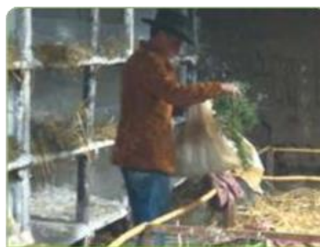
El forraje es un alimento importante para la nutrición del cuy