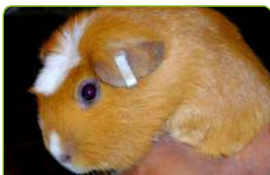
CUY MACHO SELLECCIONADO PARA EMPADRE

Consiste en juntar a las hembras con el macho para que puedan reproducirse, se recomienda comenzar a empadrear a las hembras con 800 gramos de peso vivo (PV) y a los 56 días de edad; mientras que los machos deben tener 1.0 kilo de PV y 84 días.