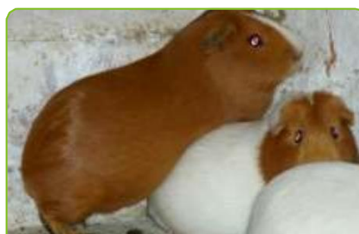
CUY MACHO EMPADRANDO A CUY HEMBRA

Los cuyes primerizos continúan creciendo hasta el año de edad. Es importante observar la preñez de la hembra al mes del empadre a fin de detectar infertilidades tanto en hembras como en machos.