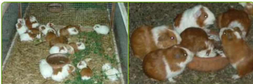
Crias destetadas ubicadas en diferentes pozos)

Consiste en separar los gazapos de las madres. La cuy madre solo tiene buena leche hasta los 14 días después del parto en la costa, a los 21 días en la sierra por ello se recomienda destetar entre los 14 a 21 días de edad.