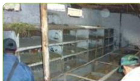
LAS JAULAS Y POZAS DEBEN SER SEGURAS