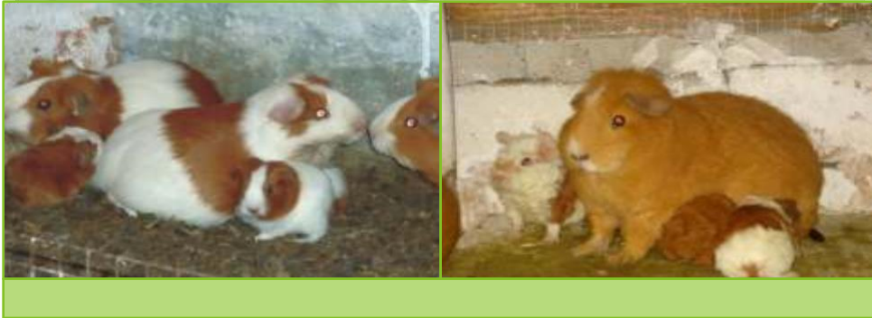
CUYES HEMBRAS CON CRIAS LACTANTES (GAZAPOS)

por parto, posibilitando crías de buen tamaño. Camada promedio es 2.61 gazapos/parto