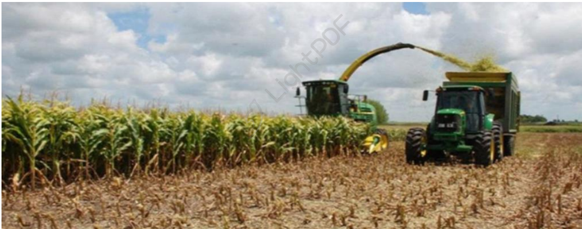
Figura 1. Cosecha de maíz forrajero

El maíz es uno de los granos alimenticios más antiguos e importantes que conoce el ser humano. Hoy en día el maíz es el segundo cultivo del mundo por su producción, después del trigo, mientras que el arroz ocupa el tercer lugar. Es el primer cereal en rendimiento de grano por hectárea y es el segundo, después del trigo, en producción total. El maíz es de gran importancia económica y social a nivel mundial ya sea como alimento humano, como alimento para el ganado o como fuente de un gran número de productos industriales. La diversidad de los ambientes bajo los cuales es cultivado el maíz es mucho mayor que la de cualquier otro cultivo. Habiéndose originado y evolucionado en la zona tropical como una planta de excelentes rendimientos. En el Perú se cultivan 236,894 ha-1 de las cuales el 49 % corresponden a maíz amarillo duro mayoritariamente en selva y costa, el 45 % a maíz amiláceo, casi en su mayor parte en la región de la sierra, 2 % cultivan el maíz para choclo, con preferencia en Costa y Sierra, el 3 % de maíz para forraje en Costa y menos 1 % como maíz morado mayoritariamente en la Costa Central.