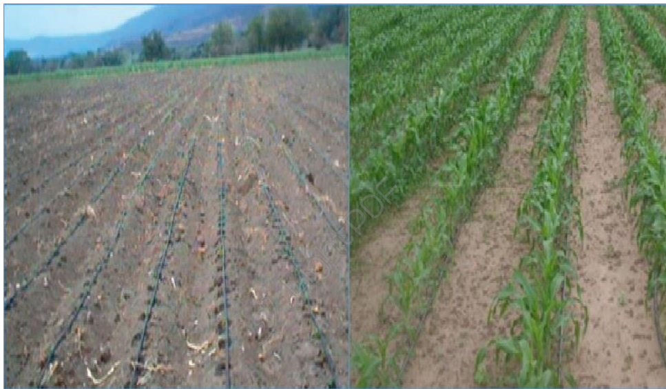
Figura 3. Riego por goteo

El riego rodado o por inundación tiene una eficiencia muy baja en el uso del agua, donde con “buen manejo” apenas se rebasa el 50 %, mientras que con el riego por goteo se tiene una mejor utilización del recurso alcanzando eficiencias que van del 90 al 95 %. Esto sin lugar a dudas se traduce en un ahorro muy significativo en la cantidad de agua aplicada, además, si se extrae de pozos profundos los costos de electricidad o combustible se reducen. Además, mediante este sistema se pueden inyectar otros insumos (fertilizantes, herbicidas, insecticidas, etc.), donde su eficiencia de uso también se mejora considerablemente, permitiendo emplear dosis más bajas y controladas e indirectamente los impactos al medio ambiente se ven reducidos.