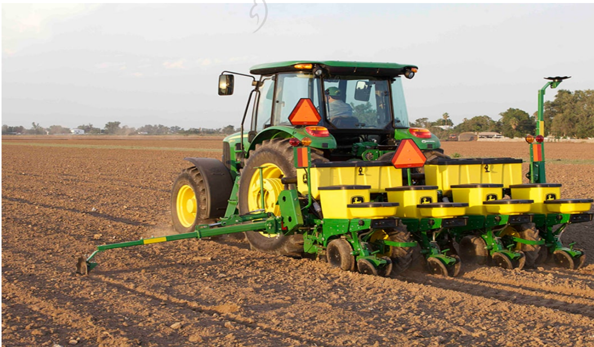
Figura 4. Sembradora de maíz forrajero

Esta labor se efectuó el 23 de setiembre 2009 colocando 4 semillas por golpe cada golpe a 30 cm de distancia entre planta y 1,5 m entre líneas a una profundidad recomendada no mayor de 5 cm.