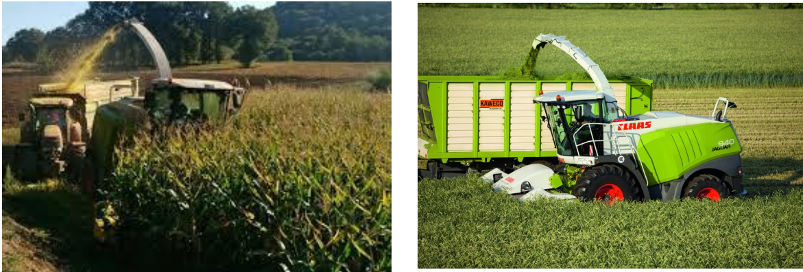
Figura 5. Cosechadora de maíz forrajero

Los híbridos de DEKALB aportan a los agricultores una genética excelente en rasgos relacionados con el rendimiento y la calidad del ensilado, como el contenido en energía, almidón y fibra, y la digestibilidad de las paredes celulares. Para que los agricultores puedan conservar estas ventajas durante el almacenamiento y el proceso de suministro a las vacas, el manejo del ensilaje tras la cosecha es fundamental.