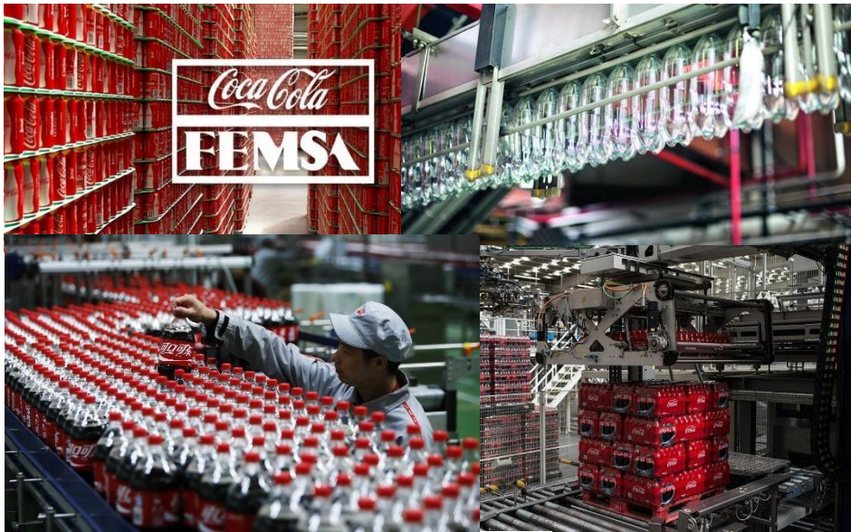
6 Planta de Coca Cola Femsa en México

El sistema que sigue la producción en masa es el Toyotismo. La empresa Toyota es pionera en métodos de organización y producción industrial. El Toyotismo surgió tras las crisis del modelo implementado por Henry Ford. La gran diferencia con el taylorismo y el fordismo es el término Just InTime , que hace referencia a la producción de lo estrictamente necesario y con previa demanda del producto, evitando así la sobreproducción.