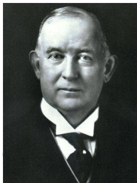
4 James Bonsack (BBC NEWS)

Por otro lado, las tecnologías de proceso continuo contribuyeron en la evolución e innovación del sistema de producción en masa. En 1881, James Bonsack patentó una máquina de cigarrillos que los liaba de forma automática, sin la intervención del hombre, este resultaba tan productivo que alrededor de treinta máquinas podían satisfacer la demanda nacional (USA) completa de cigarrillos en 1885, empleando tan sólo un puñado de trabajadores.