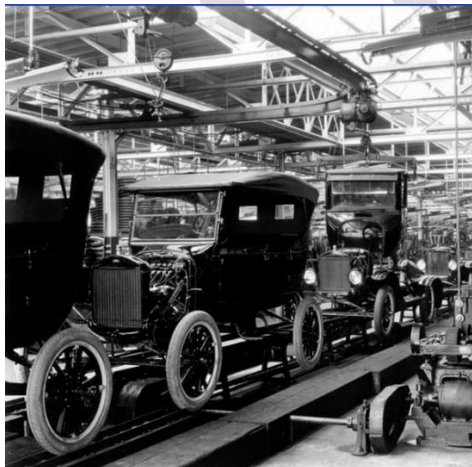
3 La línea de ensamblaje Ford Modelo T

La producción en masa es intensiva en capital y energía, ya que utiliza una alta proporción de la maquinaria y la energía en relación con los trabajadores. También es generalmente automatizada en la mayor medida de lo posible. Con menos costes laborales y un ritmo más rápido de la producción, el capital y la energía se incrementa, mientras que el gasto total por unidad de producto disminuye.