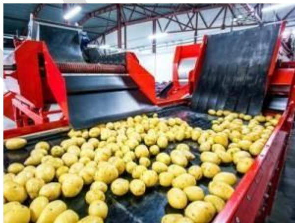
7 Producción en masa

La producción en masa moderna muestra signos de flexibilidad y adaptación y está dando pasos hacia un diseño económicamente viable, con la ayuda de las tecnologías digitales (especialmente las impresoras 3D) y trabajadores cualificados, tanto en la línea de producción como en el proceso de diseño e ingeniería, con el objetivo de crear la fábrica del futuro en la que los productos se elaboren en cantidades que garanticen una gran calidad y personalización.