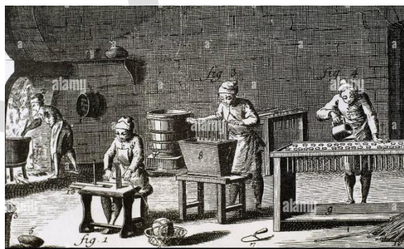
1 Producción artesanal de velas

Los tres sistemas de producción incluyen un proceso de transformación de la materia prima en bienes de consumo. Lo que las hace diferente son los medios utilizados en este proceso, la forma en que se organiza el trabajo y la mano de obra, además de los índices de producción y el mercado.