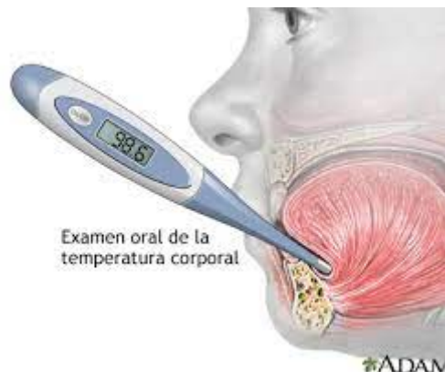
Figura 1. Medición de la temperatura vía oral.