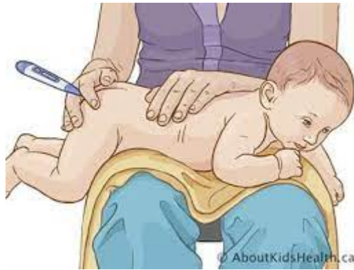
Figura 3. Medición de temperatura vía rectal