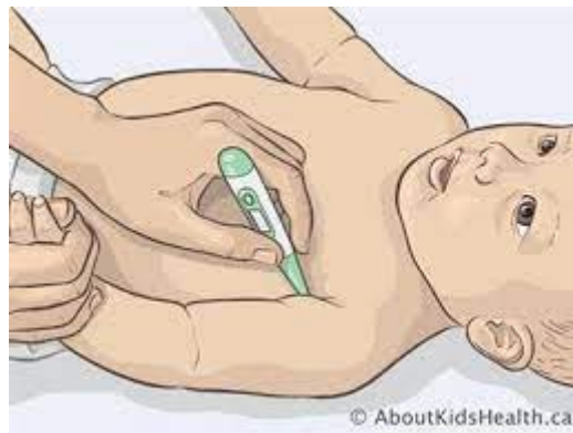
Figura 2. Medición de la temperatura vía axilar